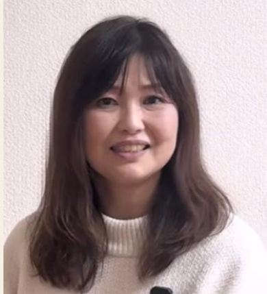
サビ管 入社2年目 Hさん