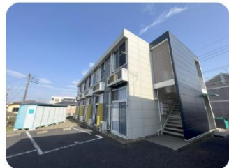
新★キノッピの家 本郷