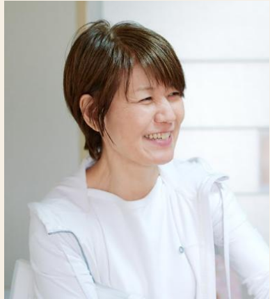
管理者 入社4年目 Hさん