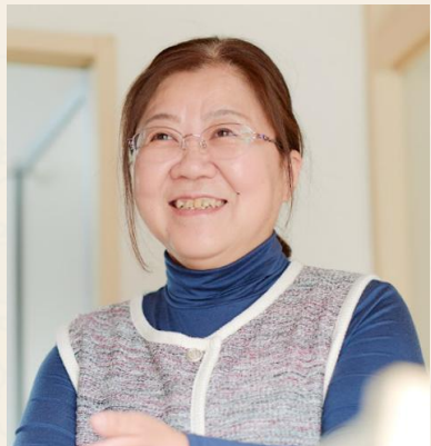
管理者 入社3年目 Iさん